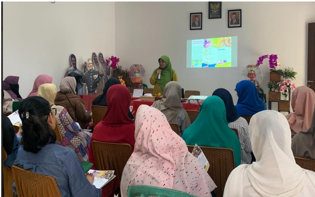
Gambar 1. Kegiatan Penyuluhan Pengabdian Pada Masyarakat