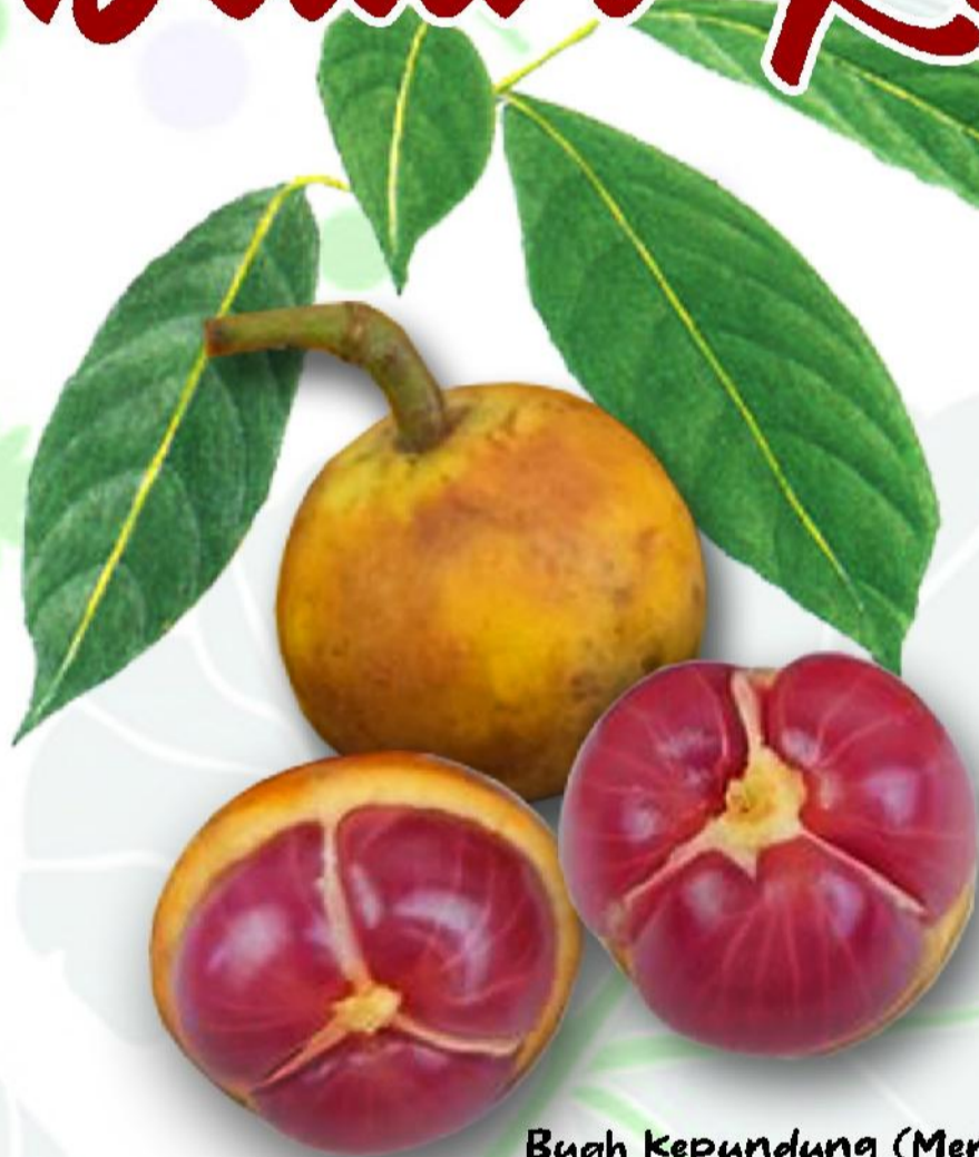
Buah Kepundung (Menteng) Nama Latin: Baccaurea racemosa