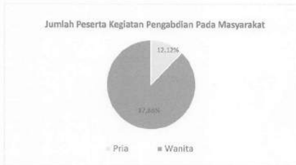
Gambar 4.3 Jumlah Peserta Kegiatan Pengabdian Pada Masyarakat

Kuesioner diisi oleh 33 peserta yang hadir dalam penyuluhan. Peserta ikut berpartisipasi dengan baik selama kegiatan berlangsung sampai dengan kegiatan berakhir baik dalam kegiatan penyuluhan maupun kegiatan workshop. Dari hasil kuesioner dan hasil wawancara diketahui sebanyak 33 orang mengisi kuesioner. Peserta yang mengisi kuesioner adalah siswa SMK 3 YAPERCIK dengan Jurusan Farmasi, yang saat ini duduk di Kelas XI. Siswa terdiri dari 29 siswa (87,88%) wanita dan 4 siswa pria (12,12%).