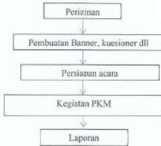
Gambar 3.1 Alur Kegiatan