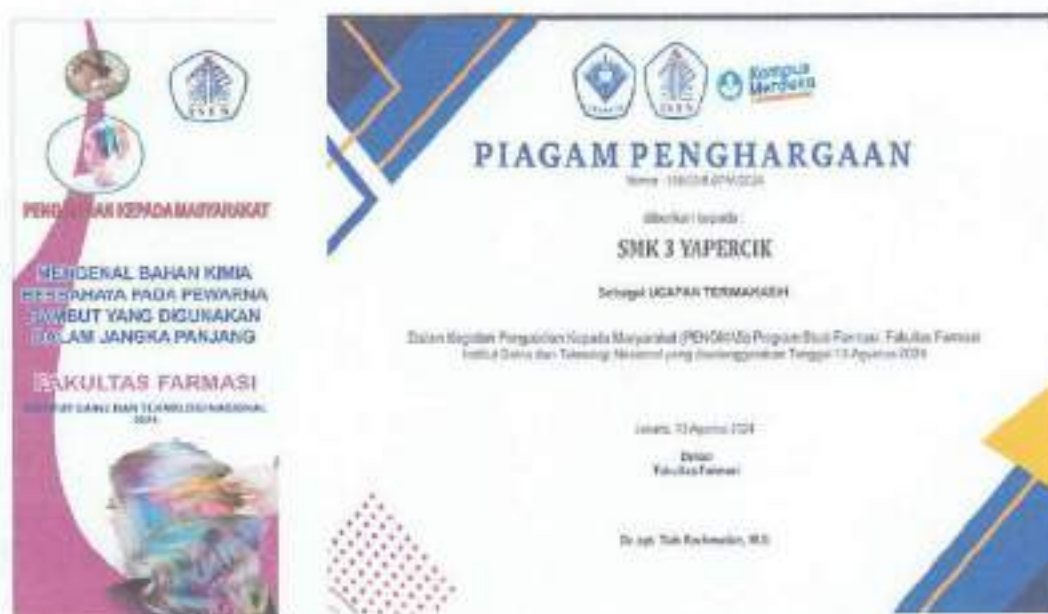
Gambar 4.1. (A). Tema Kegiatan dalam Banner, (B) Sertifikat

Persiapan yang dilakukan dalam kegiatan pengabdian pada masyarakat yaitu pembuatan banner, sertifikat yang akan diberikan kemitra dan persiapan acara penyuluhan maupun workshop.