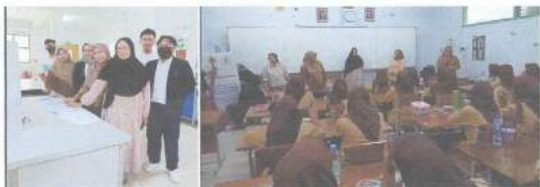
Gambar 4.2 (A). Persiapan; (B). Kegiatan Penyuluhan

Kegiatan penyuluhan diikuti oleh 36 peserta yang terdiri dari 33 siswa dan 3 guru di SMK 3 Jurusan Farmasi. Peserta terdiri dari 29 berjenis kelamin wanita dan 4 orang pria. Peserta yang terdiri dari siswa SMK 3 YAPERCIK Jurusan Farmasi sangat antusias dengan materi yang disampaikan oleh pemateri. Hal ini terbukti dari 33 peserta yang terdaftar, mengikuti penyuluhan dari awal hingga akhir acara. Bentuk apresiasi dari panitia pengabdian masyarakat ISTN kepada masyarakat yang mengikuti acara dari awal hingga akhir dan mengisi kuesioner yaitu dengan memberikan doorprize kepada 6 peserta terbaik.