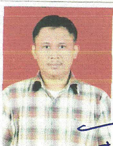
Tanda tangan pemilik (Signature of holder)

Manajer Sertifikasi Certification Manager