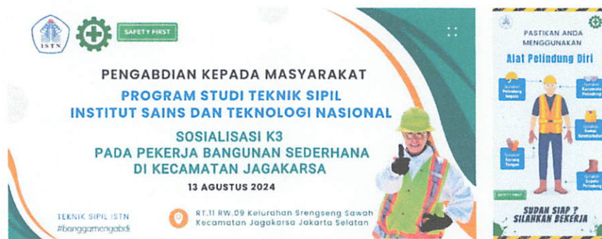
Gambar 4. Spanduk dan banner