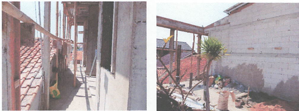
Gambar 3. Renovasi rumah milik salah satu warga