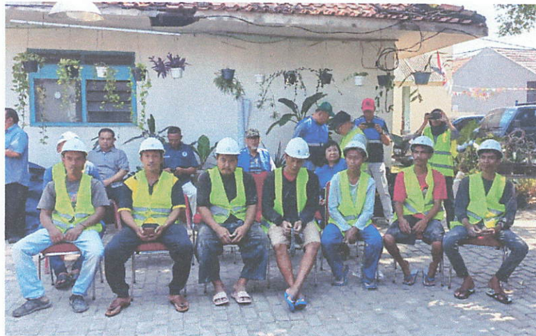
Gambar 5. Peserta sosialisasi dari pekerja