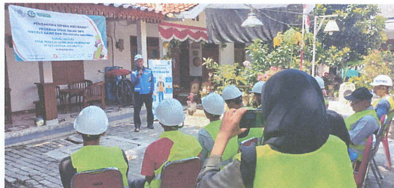
Gambar 6. Sosialisasi oleh Tim PKM