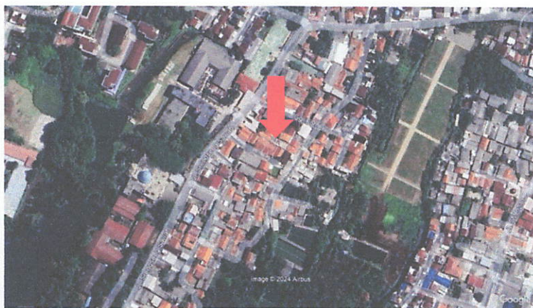
Gambar 1. Lokasi kegiatan

Lokasi pengabdian masyarakat ini berada di daerah sekitar kampus, sebagai upaya perguruan tinggi ISTN peduli terhadap masalah yang ada di Masyarakat. Tim PKM Teknik Sipil ISTN melakukan survey awal untuk mencari masyarakat yang sedang membangun atau merenovasi rumah yang didalamnya terdapat pekerja yang tidak menggunakan Alat Pelindung Diri (APD). Hasil survet awal tersebut mendapatkan rumah warga yang sedang direnovasi dengan beberapa pekerja yang tidak menggunakan APD. Tim PKM Teknik Sipil ISTN kemudian meminta izin kepada pemilik rumah dan melakukan identifikasi masalah agar dapat memberikan pemahaman tentang K3 pada pekerja dan pemilik rumah tersebut dengan sosialisasi K3.