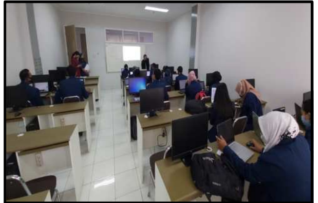
Gambar-3: Suasana Kegiatan Pra Asesmen