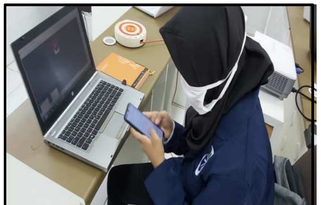
Gambar-4: Suasana Ujian Tulis