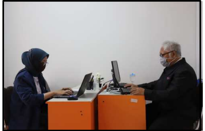
Gambar-4: Suasana Wawancara