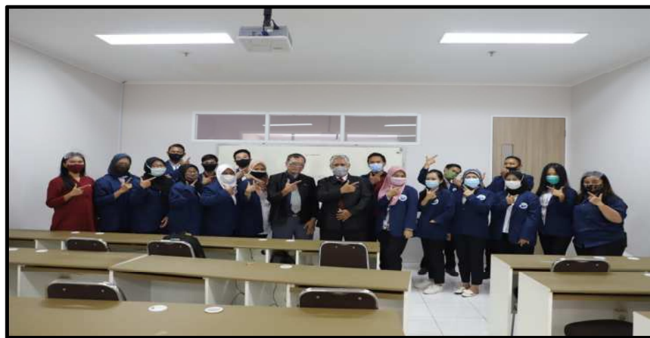
Gambar-5: Foto Bersama Setelah Asesmen Selesai