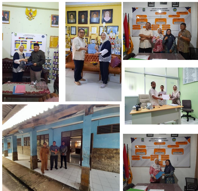
Gambar 2 Foto koordinasi dengan Kepala Sekolah di beberapa SMP Kota Bekasi