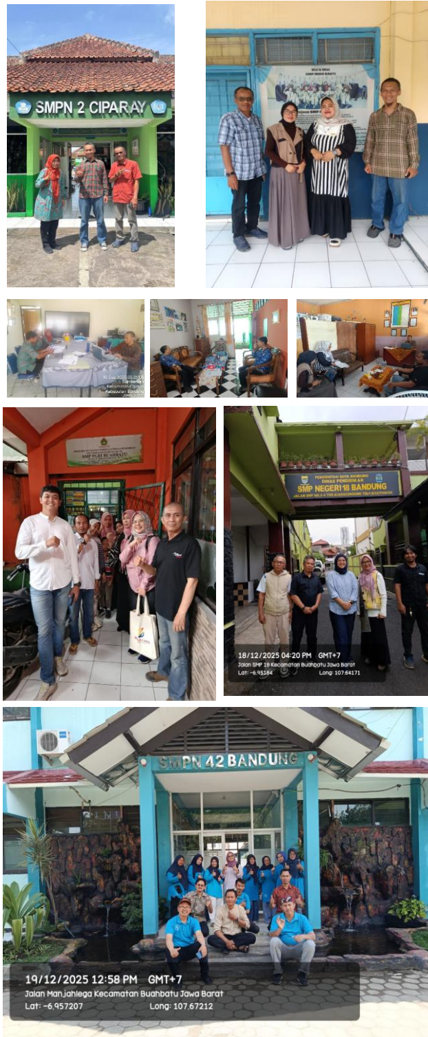
Gambar 3 Foto koordinasi dengan Kepala Sekolah di beberapa SMP Kab. Bandung