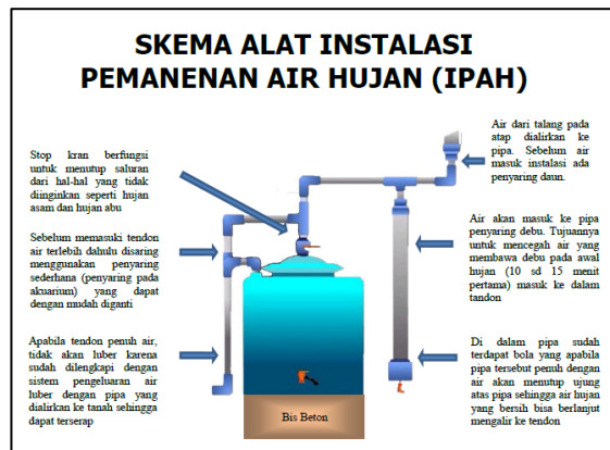
Gambar Foto 9: Contoh Skema Instalasi Penampungan Air Hujan

Menggunakan Tangki penampungan air hujan