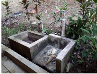
Gambar Foto 7: Kran Air yang sudah Rusak

Pada gedung area gedung terdapat kran air yang tidak berfungsi dan perlu di perbaiki