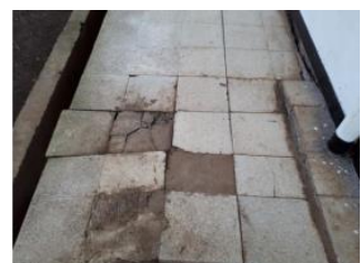
Gambar Foto 3, 4 dan 5 : Beberapa elemen tapak dan furniture yang rusak

Hal yang perlu dilakukan untuk dilakukan untuk permasalahan ini ialah membangun public space dan memperbaiki tapak, sehingga interaksi antar mahasiswa, dosen dan penghuni kampus yang lainnya menjadi aktif.