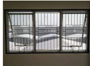
Gambar Fot 11 dan 12 : Contoh Jendela besar agar terlihat Pemandangan Keluar gedung