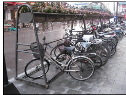
Gambar Foto 1 dan 2 : Contoh Fasilitas Parkir Sepeda