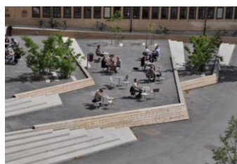
Gambar Foto 6: Contoh Publicspace didepan area Gedung C dan D

Hal yang perlu dilakukan untuk dilakukan untuk permasalahan ini ialah membangun public space dan memperbaiki tapak, sehingga interaksi antar mahasiswa, dosen dan penghuni kampus yang lainnya menjadi aktif.