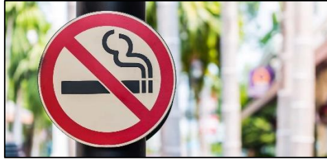
Gambar Foto 10 : Contoh Larangan Meerokok Pada Area Gedung