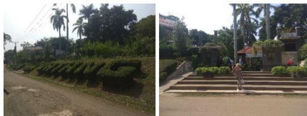
Gambar 8. View dari luar tapak

View dari dalam tapak terlihat indah jika dilihat dari atas bukit kapur yaitu berupa hamparan sawah yang hijau dan dibagian lain berupa rumah warga. Sedangkan view dari luar tapak berupa vegetasi yang ada di dalam tapak.