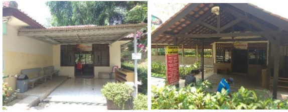
Gambar 10. Area Pemandian Air Panas VIP

Pada pemandian air panas Tirta Sayaga ini terdapat 2 area pemandian air panas VIP yaitu alamanda dan bougenvile, pada pemandian VIP ini terdapat kamar-kamar pemandian dan kolam renang. Selain itu pada pemandian VIP alamanda juga terdapat fasilitas untuk terapi seperti terapi lintah dan terapi bekam.