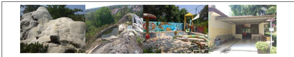
Gambar 3. Pemandian Air Panas Tirta Sayaga.

Kawasan wisata pemandian air panas Tirta Sayaga, wisata pemandian air panas Tirta Sayaga ini merupakan salah satu objek wisata yang ada di Kabupaten Bogor. Adanya sumber mata air panas yang membentuk gundukan berwarna putih yang disebut travertin atau yang dikenal masyarakat sebagai Gunung Kapur, menjadi daya tarik kawasan wisata tersebut. Sumber mata air panas yang mengandung kalsium, magnesium, karbonat, besi, mangan, kalium, bikarbonat, klorida dan sulfat memiliki khasiat untuk menyembuhkan beberapa penyakit seperti penyakit kulit, tulang, therapy , kelumpuhan, kecantikan dan lain sebagainya. Maka dari itu pemandian air panas Tirta Sayaga ini bisa menjadi alternatif berwisata yang menyehatkan sambil berekreasi.