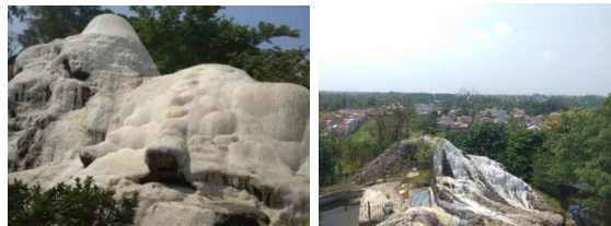
Gambar 9. Bukit Kapur

Di dalam tapak yang berukuran sekitar 2,2 hektar ini terdapat sebuah bukit berwarna putih yang disebut dengan istilah travertine atau yang biasa dikenal bukit kapur atau gunung kapur. Gunung kapur ini menjadi salah satu daya tarik yang ada di kawasan pemandian air panas Tirta Sayaga ini.