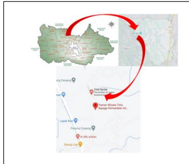
Gambar 2. Peta Administrasi Kabupaten Bogor (atas kiri), Peta Kec. Parung (atas kanan) dan Peta kawasan wisata pemandian air panas Tirta Sayaga (bawah).

Kegiatan penelitian ini dilakukan di Kawasan Pemandian Air Panas Tirta Sayaga, Kabupaten Bogor. Kawasan ini memiliki luasan sekitar 2,2 hektar dengan adanya sebuah bukit kapur (Gambar 2).