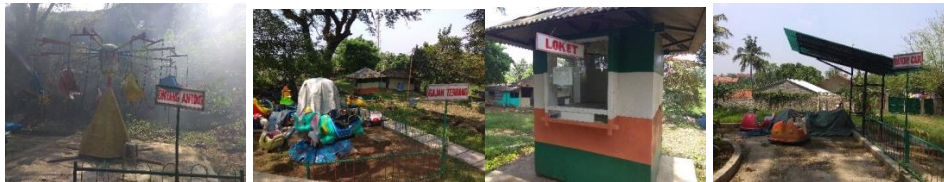
Gambar 12. Area Wahana Permainan Anak

Di dalam wisata pemandian air panas Tirta Sayaga ini terdapat beberapa wahana permainan anak yang kondisinya sudah tidak bagus, penempatan wahana permainan yang tidak teratur membuat area ini terlihat sempit dan berantakan.