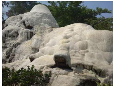
Gambar 1. Bocca Travertine di pemandian air panas Tirta Sayaga.

Dengan luas area yang semakin berkurang, maka objek daya tarik dan fasilitas wisata di pemandian air panas Tirta Sayaga menjadi berkurang, dan itu berpengaruh terhadap jumlah kunjungan wisata. Pada penelitian sebelumnya yang dilakukan oleh Milasari (2010), diketahui pada tahun 2009 jumlah kunjungan wisata bisa mencapai 20.000 pengunjung/bulan. Menurut hasil wawancara yang penulis lakukan, setelah berganti pengelola, jumlah kunjungan wisata kurang dari 5.000 pengunjung/bulan dan dalam masa pandemi COVID-19 jumlah pengunjung hanya mencapai sekitar 500 pengunjung/bulan. Pada kawasan pemandian air panas Tirta Sayaga ini juga zonasi pada area wisata belum optimal, seperti letak kios makanan dan wahana permainan anak. Maka dari itu, perlu adanya perencanaan dan perancangan kawasan wisata yang sesuai dengan kondisi lingkungan agar jumlah pengunjung yang berkurang bisa meningkat.