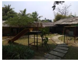
Gambar 14. Area Children Play Ground

Terdapat area children play ground yang terletak dekat dengan musholah dan pemandian air panas VIP sehingga anak-anak yang sedang menunggu bisa bermain di area children play ground ini. Tetapi wahana yang ada di children play ground ini kurang bervariasi.