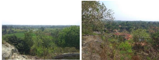
Gambar 7. View dari dalam tapak