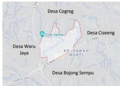
Gambar 4. Peta Desa Bojong Indah

Secara geografis pemandian air panas Tirta Sayaga ini terletak di 106^{\circ}41'45''\text{BT} dan 6^{\circ}25'54''\text{LS} . Wisata pemandian air panas Tirta Sayaga ini memiliki luas wilayah sekitar 2,2 ha. Sementara itu, untuk batasan tapak, wisata pemandian air panas Tirta Sayaga berbatasan dengan area persawahan dan rumah penduduk.