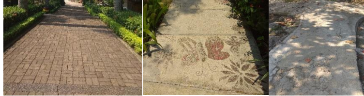
Gambar 6. Sirkulasi didalam tapak

Sirkulasi pada area penerimaan memiliki lebar sekitar 4 meter dengan material berupa paving blok sedangkan pada area dalam tapak, sirkulasi dengan material beton yang memiliki lebar sekitar 1.5 meter.