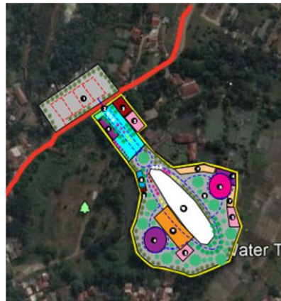
Gambar 15. Block Plan

Dari beberapa hasil konsep pengembangan, maka didapatkan peta rencana blok atau block plan , seperti pada (Gambar 15).