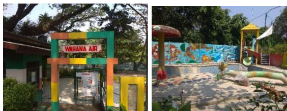
Gambar 11. Area Wahana Air

Area wahana air yaitu area kolam renang air panas yang disediakan untuk anak-anak dan terdapat ornamen-ornamen serta perosotan untuk anak-anak bermain di dalamnya.