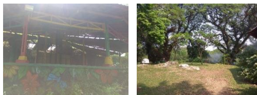
Gambar 13. Area Piknik dan Panggung Acara

Area piknik pada wisata pemandian air panas Tirta Sayaga terletak di depan panggung acara, sehingga apabila sedang ada pertunjukkan acara, para pengunjung yang sedang duduk-duduk di area piknik dapat melihat pertunjukkan acara tersebut.