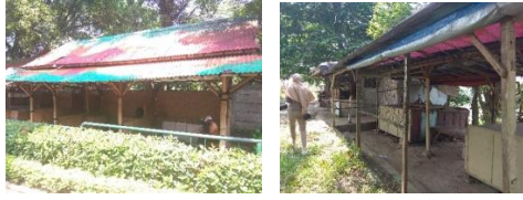
Gambar 14. Area Kios Makanan

Kios makanan terletak di beberapa titik lokasi di dalam wisata pemandian air panas Tirta Sayaga ini, yaitu di area penerimaan, di dekat area piknik dan di dekat area children play ground , penyebaran area kios makanan ini memudahkan pengunjung yang ingin membeli makanan pada lokasi terdekat, kios makanan ini yaitu bangunan yang terlihat kumuh dan penempatannya yang kurang rapi sehingga terlihat berantakan.