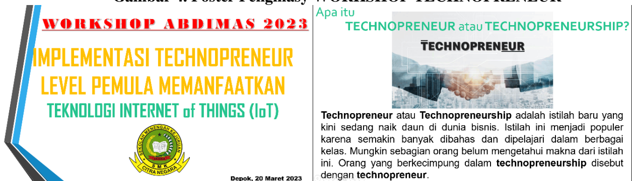
Gambar 5. Materi WORKSHOP TECHNOPRENEUR

Acara diakhiri dengan sesi tanya jawab tentang materi yang diberikan. Adapun evaluasi yang dilakukan adalah secara lisan dan terbuka dan secara langsung kepada masing-masing peserta dan diikuti dengan proses pelaporan dan publikasi