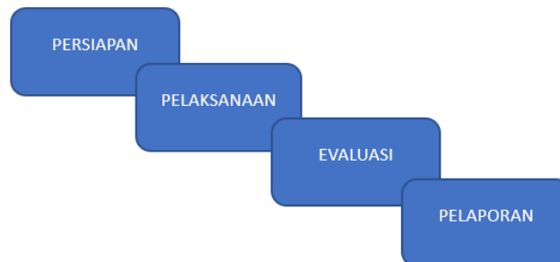
Gambar 1. Metode Kegiatan PKM

Metode yang dilakukan yaitu tahapan prosedur kegiatan Pengabdian Kepada Masyarakat antara lain seperti terlihat pada gambar 1.berikut :