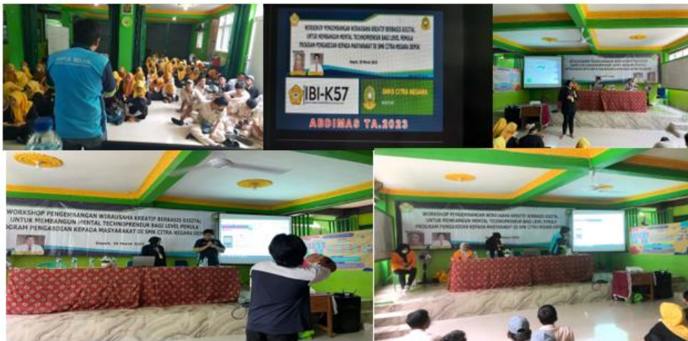
Gambar 3. Kegiatan Pengabdian Kepada Masyarakat Workshop teknologi digital bagi wirausaha Pemula

baik, maka materi diikuti dengan materi teknis teknologi dengan sedikit praktek mengenai dukungan teknologi sosial media dalam dunia bisnis. Para pemula bisnis dari SMK Citra Negara pun dapat menyimak dengan baik dan kondusif semua materi yang diberikan