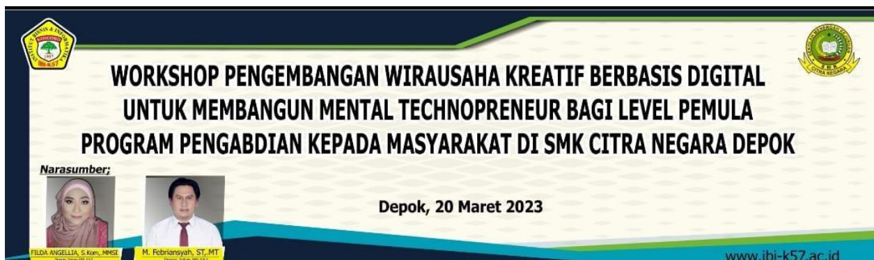
Gambar 4. Poster Pengmasy WORKSHOP TECHNOPRENEUR

Pada materi kedua yaitu materi yang menjelaskan tentang Internet of Things yang merupakan perangkat teknologi yang dapat digunakan untuk kemajuan proses bidang usaha tertentu seperti contohnya adalah smart lamp , smart feeding dan lain sebagainya. Adapun Internet of Things yang memang pasti dibutuhkan adalah penggunaan internet itu sendiri yang diikuti dengan penggunaan sosial media dan media digital lainnya