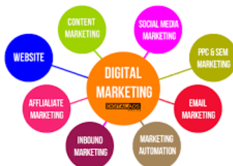
Gambar 1. Digital Marketing Channel

Teknologi digital berkembang dengan cepat untuk mendukung berbagai bidang kerja. Pengaplikasian teknologi digital dimaksudkan untuk memudahkan serta mengurangi waktu kerja. Perangkat lunak dan perangkat keras yang melakukan tugas yang diinginkan user merupakan pendukung utama teknologi digital yang berjalan. terkait teknologi digital saat ini, dapat diungkapkan bahwa kalangan wirausaha pemula yang produktif adalah user teknologi. Penggunaan teknologi yang berkaitan dengan kegiatan wirausaha dikenal dengan istilah technopreneur . Hal tersebut merupakan hal yang sangat penting dalam mendukung peningkatan bisnis Tujuan dari kegiatan pengabdian ini adalah meningkatkan kapasitas bisnis para wirausaha pemula melalui penggunaan dan pemanfaatan alat atau media digital . Metode yang digunakan adalah dalam bentuk workshop . Hasil akhir yang dicapai adalah berupa ilmu pengetahuan dan keterampilan serta peningkatan kemampuan praktis untuk menunjang kegiatan bisnis para pemula.