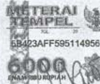
Ir. Anman, MT