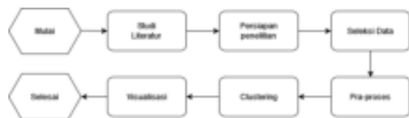
Gambar Tahapan Penelitian

Tahapan penelitian dibentuk dengan tujuan penelitian berjalan dengan baik dan terstruktur. Penelitian ini memiliki beberapa tahapan yang akan dilakukan.