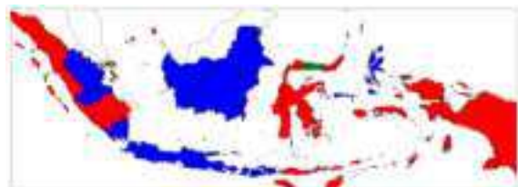
Gambar Grafik Peta Kasus Kriminal dalam kategori Fisik

Proses penggambaran dilakukan dengan bantuan library matplotlib. Matplotlib menggunakan koordinat yang disediakan oleh shapefile untuk memvisualisasikan data ke dalam bentuk peta. Berikut adalah contoh visual peta dari kategori fisik.